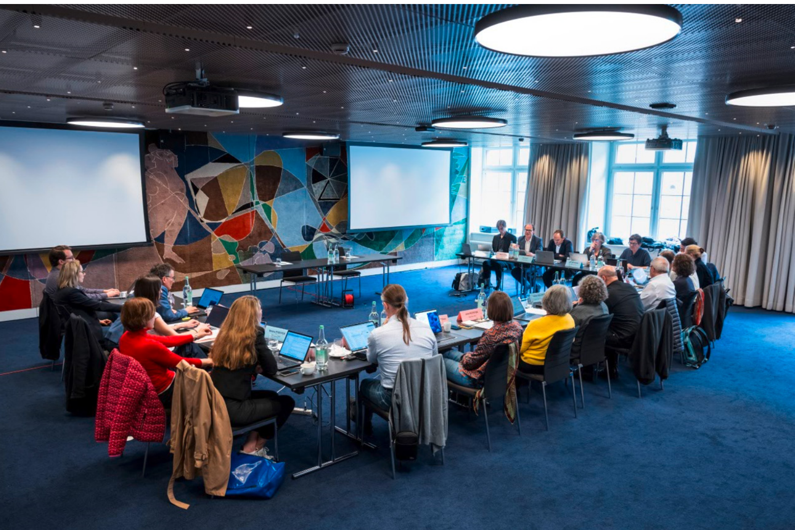
Plenarsitzung des SWR mit den Ratsmitgliedern und der Geschäftsstelle